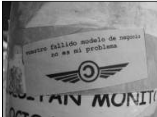
Fotografía tomada por Luis Cervantes en Cartagena, Murcia.

En España se ha generalizado la amenaza de que nosotros seremos los siguientes en ser demandados por las grandes empresas discográficas. Millones de familias están en el punto de mira bajo bendición de algunos artistas y del gobierno. De este gobierno y del anterior a éste. Mientras tanto, en las paredes de las calles han aparecido gritos anónimos de los amenazados y que dicen lo que los telediarios callan: “ vuestro fallido modelo de negocio no es mi problema ”.