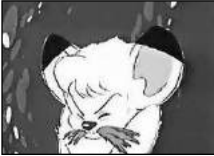
Kimba comiendo hierba.