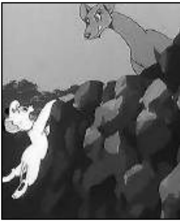
Obra de Tezuka.