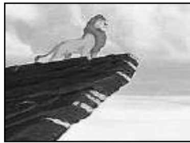
Obra de Disney.

Sangrantes. Junto a él está Mufasa, padre de Simba, que, desde los cielos, dice: “ debes vengar mi muerte Kimba, ehh... digo, Simba ”.