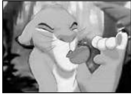
Simba comiendo insectos.