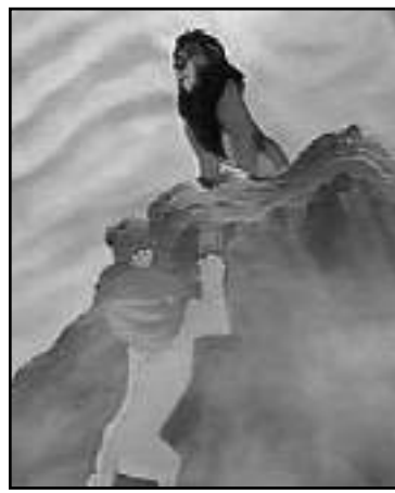
Obra de Disney.