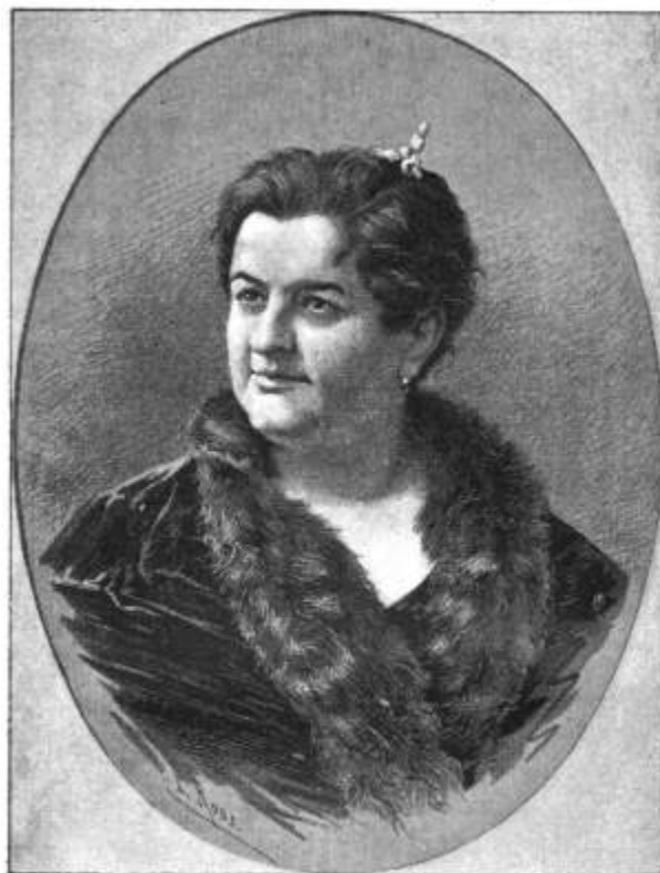
Emilia Pardo Bazán