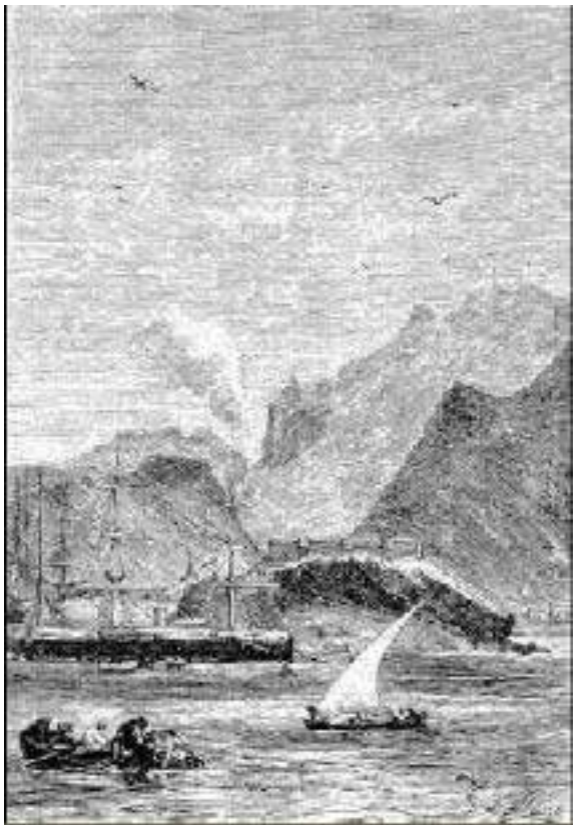
escala em Steamer-Point.