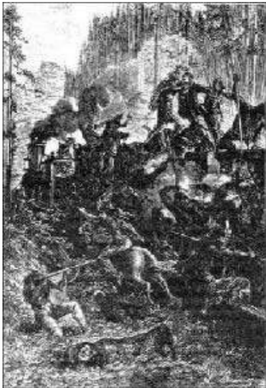
Os Sioux tinham invadido...