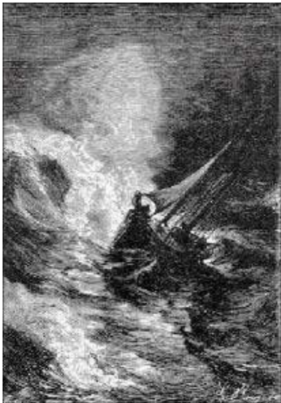
A Tankadère foi levantada como uma pena