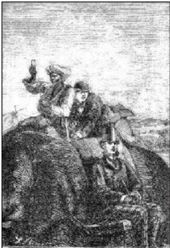
rindo entre seus saltos